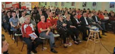
Zahlreiche Mandatarinnen und Mandatäre folgten der Einladung