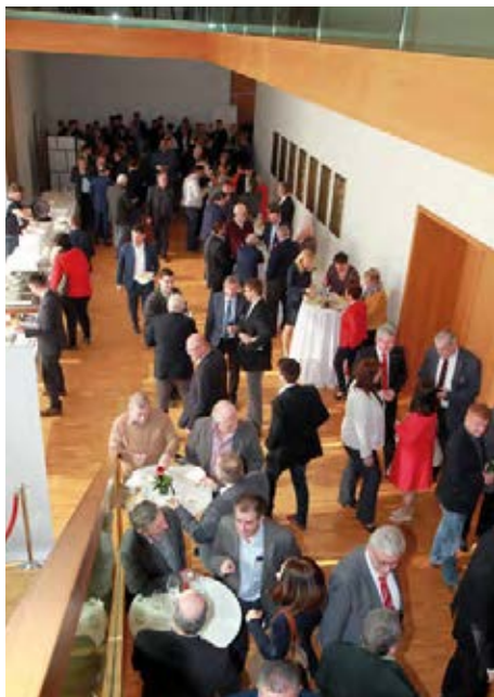
Die zahlreichen Gäste nutzten die Konferenz zu Gesprächen um sich auszutauschen