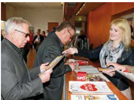
Mitarbeiterinnen des GVV Burgenland informierten die Gäste mit zahlreichen Broschüren und Unterlagen