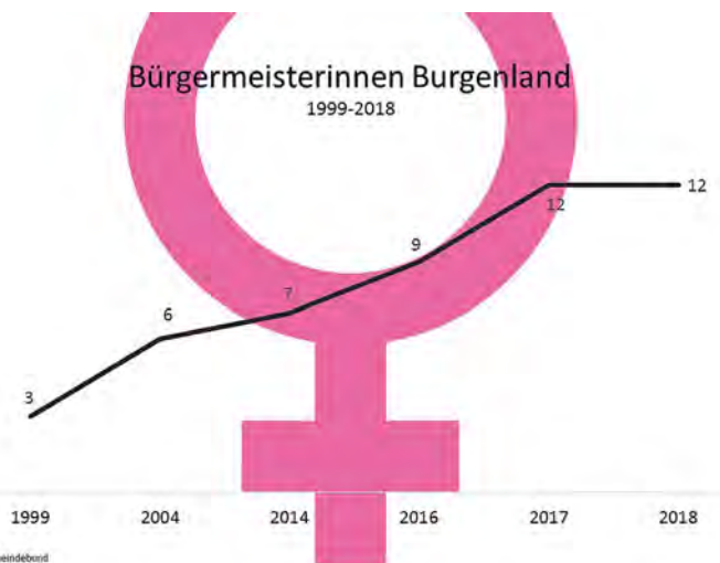
Entwicklung der Bürgermeisterinnen im Burgenland von 1999 bis März 2018